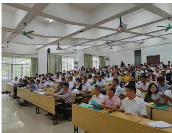
（班主任现场组织本班学生填表）

根据学校 2024 届毕业生工作安排，2023 年 4 月 8-9 日乡村振兴学院组织 2021 级“双学历”专班学生在海南职业技术学院开展毕业前相关材料填写、拍摄班级毕业合照、开展主题讲座和电子图像信息采集等系列活动。各班主任分别组织本班学生进行各项学籍材料填写，为毕业学籍档案做好基础材料；组织学生在学校图书馆前拍摄毕业班集体照，给大学生生活留下一个美好回忆；完成了学信网图像信息采集工作，本次采集的图像信息将直接作为 2024 届毕业生毕业证书照片和教育部学历证书网上电子注册的重要依据，并为毕业生学历电子注册工作提供精准的基础数据。此次活动均在规范、有序中推进，圆满完成了此次活动既定的全部内容。