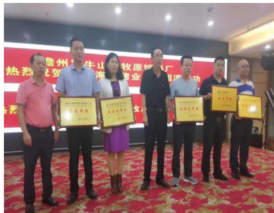
（我院被授予副会长单位）