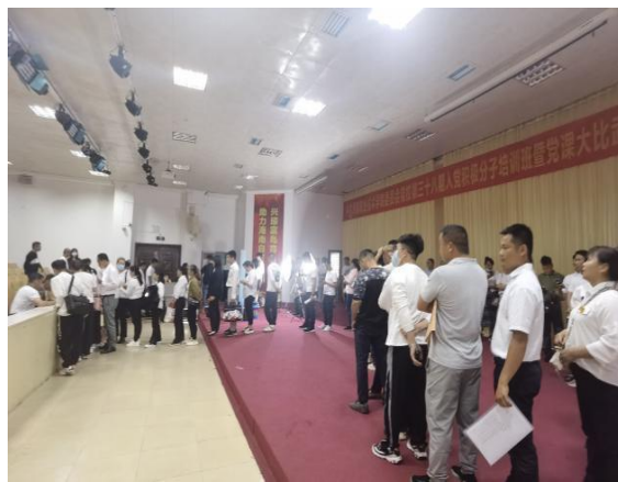
（学生们有序进凸显采集）