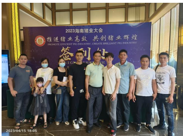
（签到老师与学生合影）

2023年4月15-16日乡村振兴学院组织畜牧兽医专业2020级“双学历”专班学生在海南省海口市永嘉大酒店开展《学术会议及沙龙活动》。此次活动分两部分内容进行，第一部分是组织学生参与海南省养猪行业协会年会及养猪专家们的学术会议专题讲座，学习生猪养殖产业链相关的专业理论知识；第二部分是组织学生围绕生猪养殖为主题进行沙龙活动交流探讨。通过此次学术会议沙龙交流活动，学生们不仅扩宽了眼界，更是收获了专业知识，参与此次活动的学生们均获得了海南省养猪行业协会2023年会暨海南职业技术学院乡村振兴学院“智慧猪业”沙龙优秀会员证书；经过我院与海南省养猪协会的共同探讨，海南省养猪协会决定聘海南职业技术学院乡村振兴学院为副会长单位。