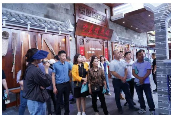
（学生们了解沙美村）

根据 2020 级“双学历”专班人才培养方案要求，结合学院教学计划于 2023 年 4 月 15 日组织 20 级学生赴琼海博鳌镇沙美村开展以“美丽乡村建设”为主题的现场教学、实地观摩和考察调研实践教学活活动。琼海市委组织部部务委员吴清尧出席活动并作动员部署讲话。此次研学带领 20 级学生深入沙美村进行实地考察学习，以“美丽乡村建设”为主题，内容实施设计上党建结合专业，使学员直观而深入地了解到乡村旅游的规划与运营。通过一系列实地考察交流和分享，学员们对于其自身所在地的乡村规划治理及如何结合农旅实现产业融合有了自己更深入的理解与创新思考，进一步拓宽了“两委”学生的眼界和思路及综合能力素质。