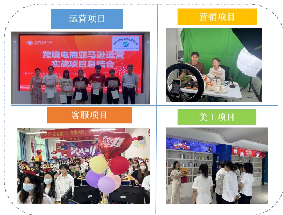
图 2 共同开发实践教学资源

在您好科技集团指导的短视频营销课程中，学生通过注册 TikTok 店铺，从策划、拍摄到后期制作，全方位掌握了实战技能。这一过程特别注重资源的共享与整合，企业贡献其最新的行业案例、技术工具和 workflows，学校则将这些资源转化为教学内容，形成了一套既符合行业标准又满足教学需求的综合性资源体系。这种资源体系不仅确保了教学资源的实用性和前沿性，也使 学生能够紧跟行业发展，提升就业竞争力。