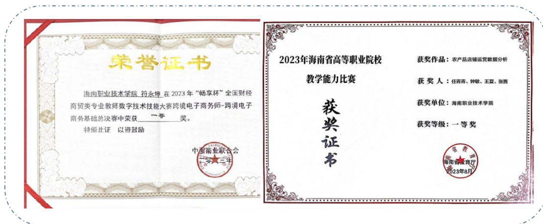
图 4 教师获奖

技术技能大赛一等奖，如图 4 所示。教学团队立项海南省应用外语研究基地课题 1 项、海南教育厅教改课题 3 项，其中重点教改课题 1 项。海口市社科联课题 1 项，校级课题 3 项，参编跨境电商专业教材 4 部，发表专业论文 10 篇以上。